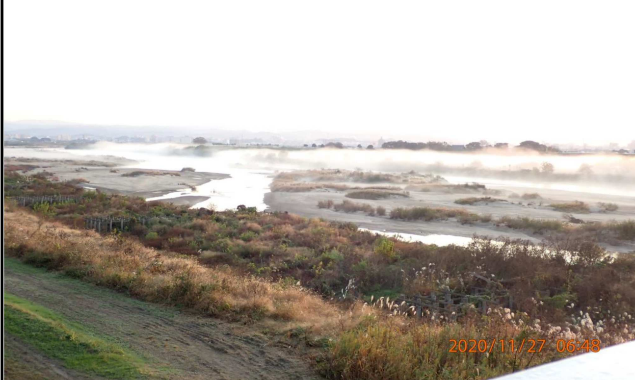
右岸18km付近の美矢井橋より上流を撮影。水面の様子が幻想的に見えた。