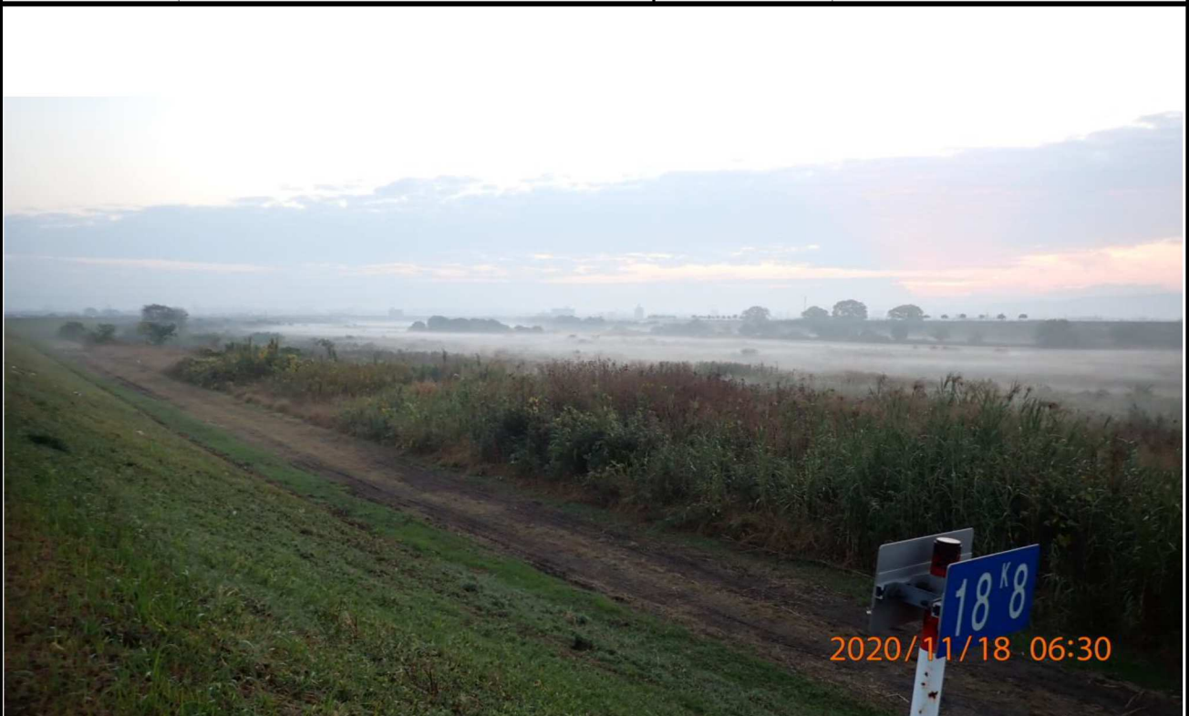
右岸18.8km付近より上流を撮影。