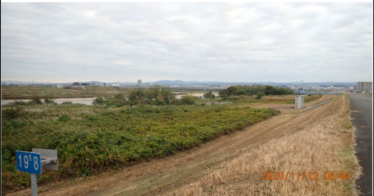
左岸19.8km付近より上流を撮影。斜面の除草が済んでいる。