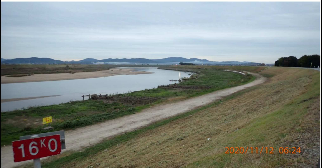
右岸16km付近より下流を撮影。樹木伐採後に斜面も除草されている。