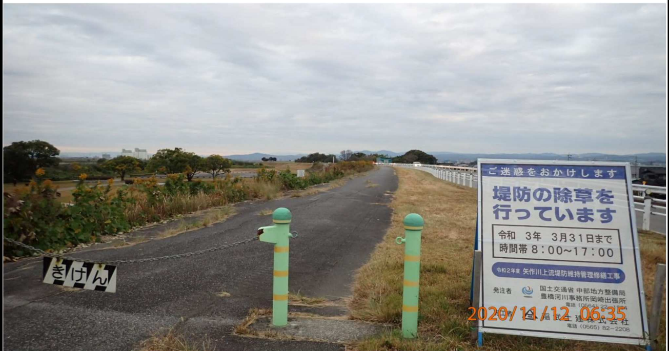
左岸18km付近の工事案内かバツ。