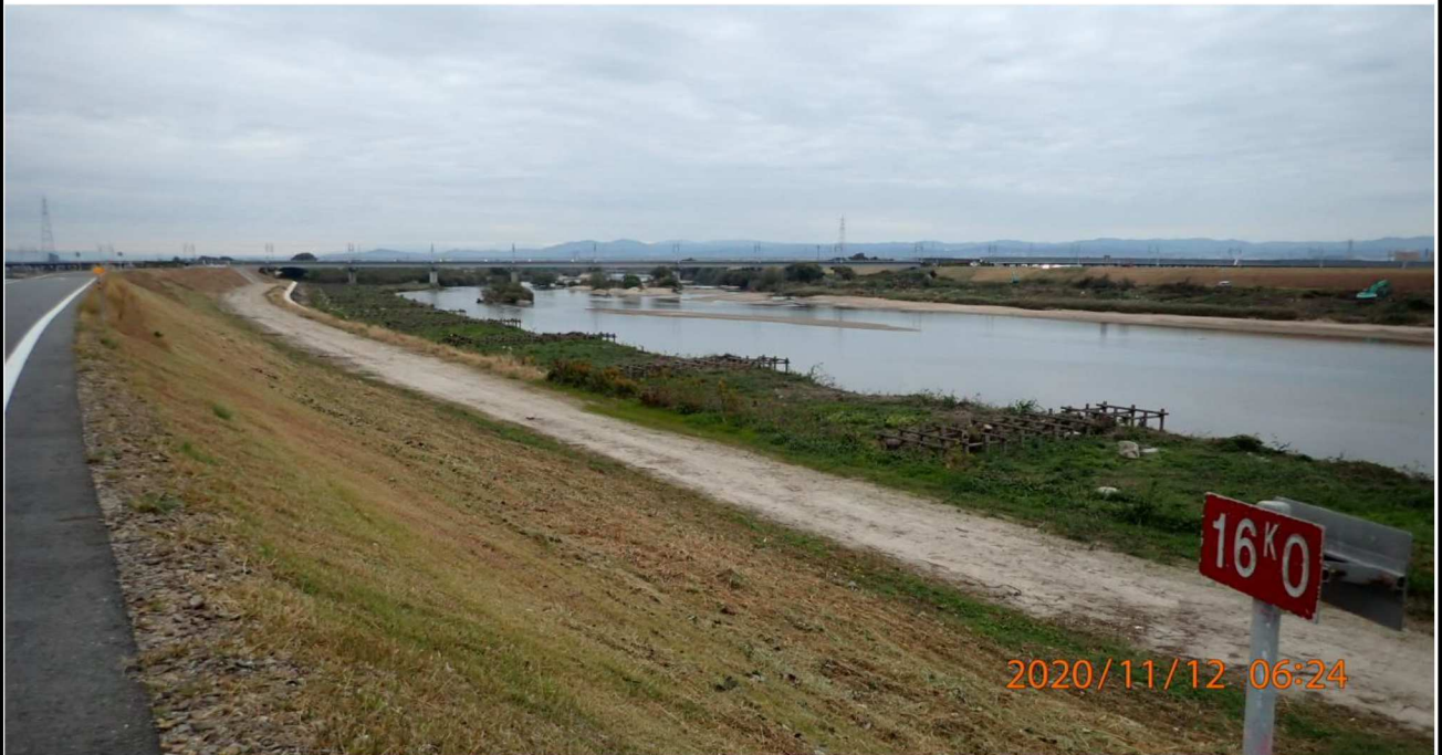
右岸16km付近より上流を撮影。