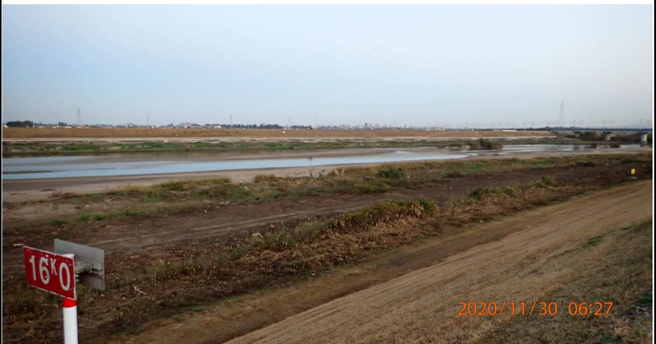
左岸16km付近より上流を撮影。樹木伐採の後、斜面も除草された。