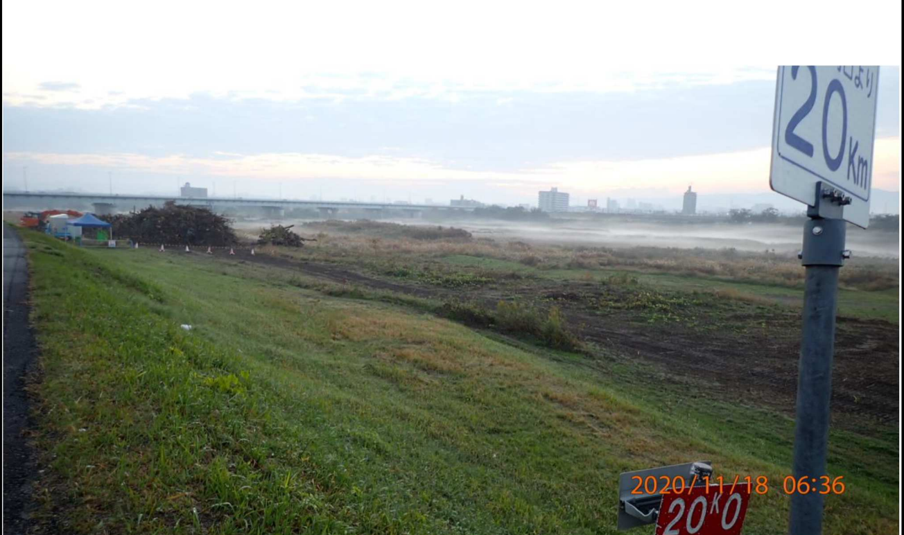
右岸20km付近より上流を撮影。この日は水面に霧が見えた。