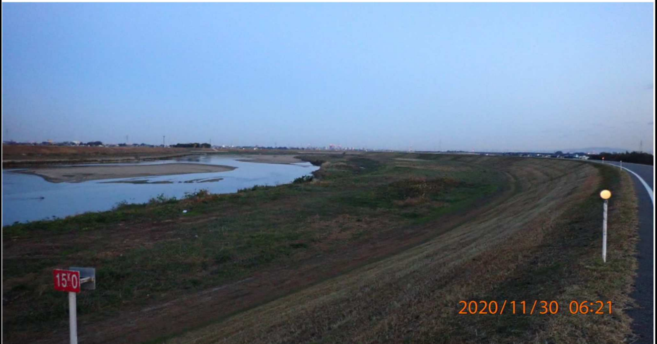
左岸15km付近より上流を撮影。