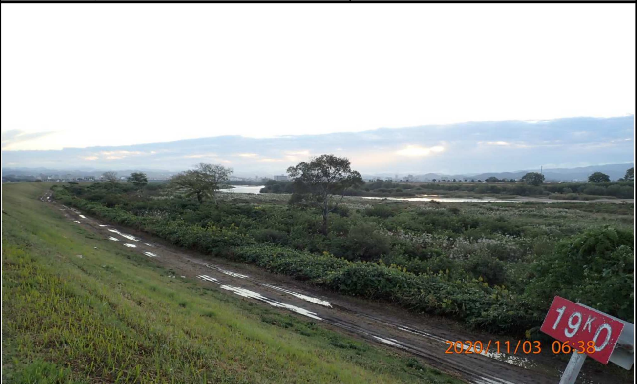
右岸19km付近より上流を撮影。