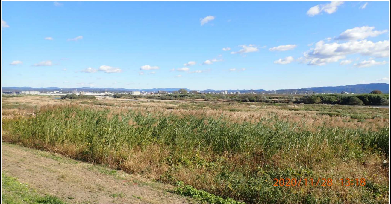
右岸18.6km付近より上流を撮影。