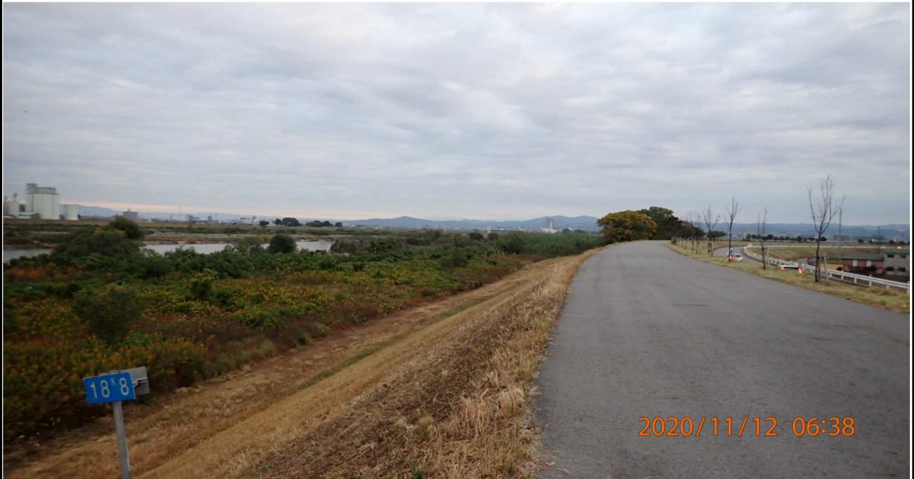
左岸18.8km付近より上流を撮影。