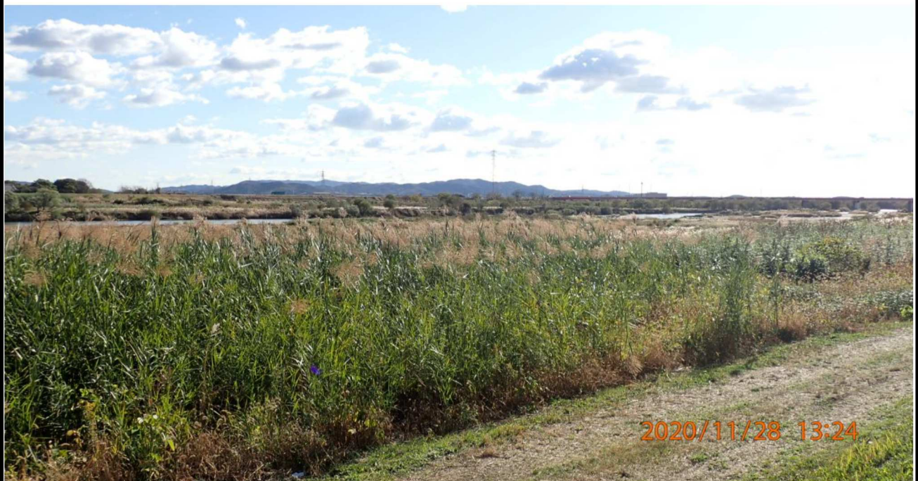
右岸18.6km付近より下流を撮影。ヨの群落が見れる。