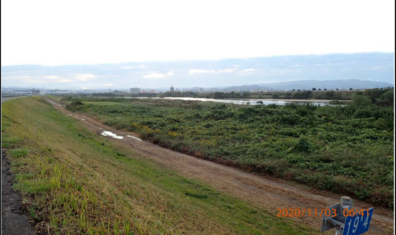
右岸19.4km付近より上流を撮影。