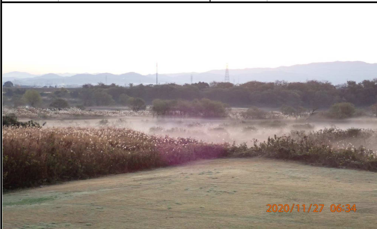
右岸17km付近より対岸を撮影。