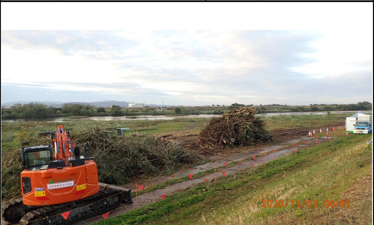
右岸20km付近より下流を撮影。伐採後の樹木が集められている。