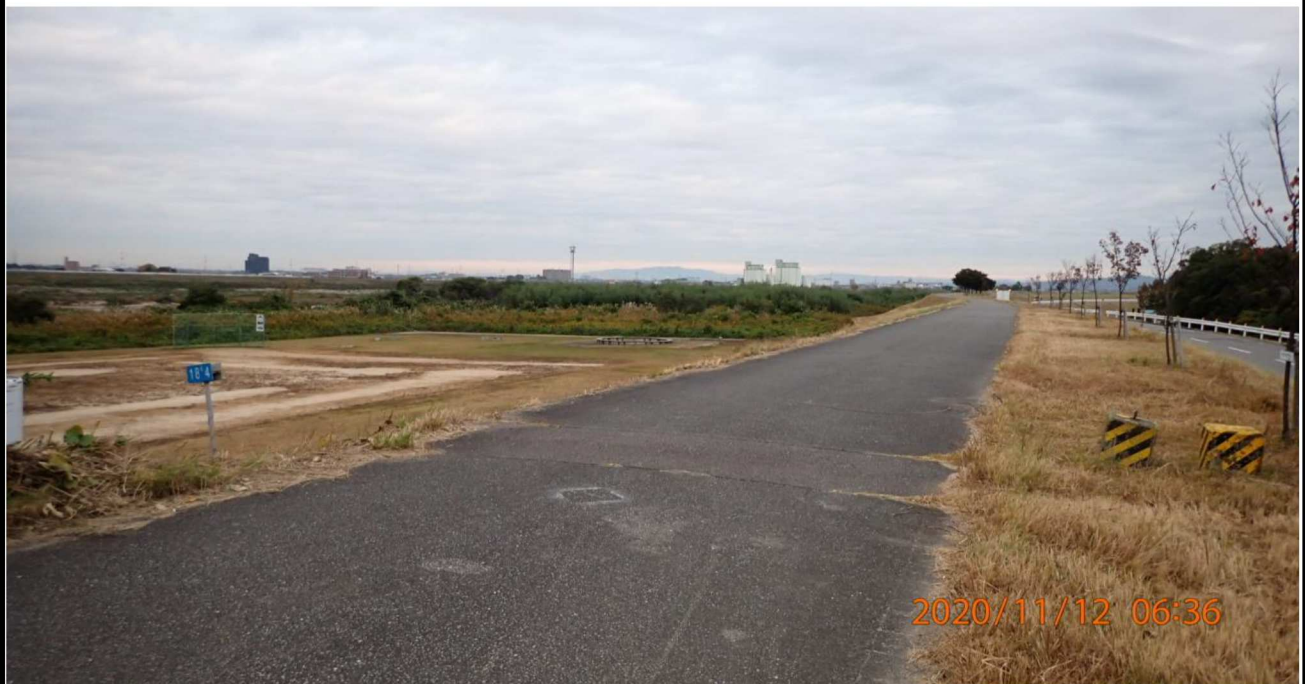
左岸18.6km付近より上流を撮影。遊歩道の見通しが良くなっている。