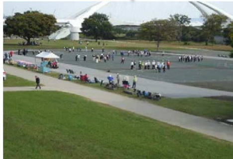
大きな、ゲートボール大会が、開かれており、多くのシニアがゲームに参加していました。