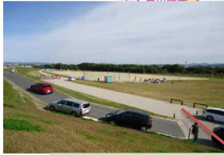
豊田大橋の北側は、野球