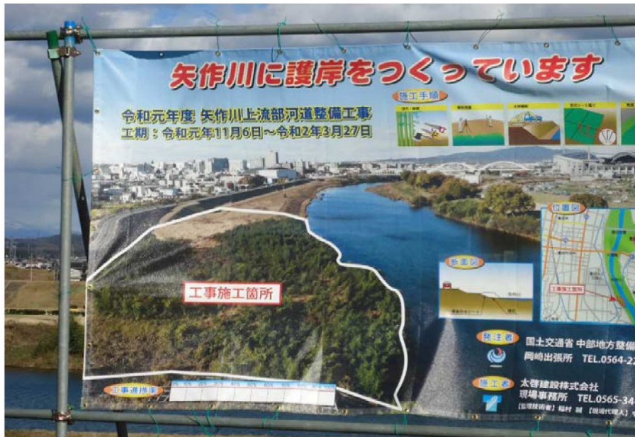
現場にあった工事案内幕