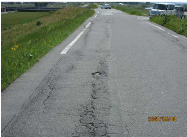
通行量も多くセンターラインも引けない道幅