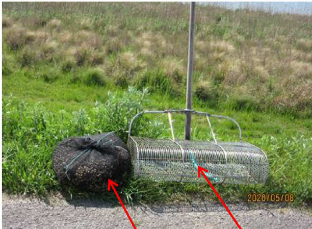
満ち潮で作業を終えた人に聞いたところ貝採ジョレン【マンガ、ワイア隙間8mm位?】を使ってシジミ収穫