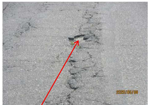
路面の破損、亀裂、段差が見られる