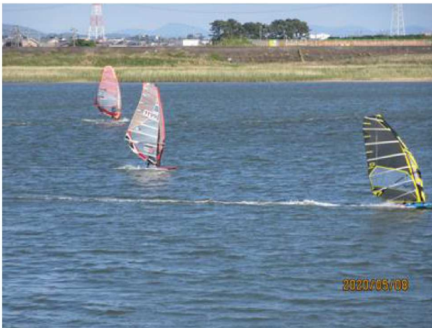
ウィンドサーフィン、を楽しむ人々【15人以上】