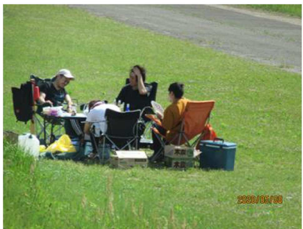
バーベキューを楽しむ人々【火は使用禁止?】