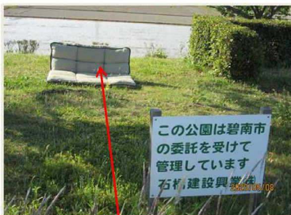
【右岸.6. 5km】ソファの放置