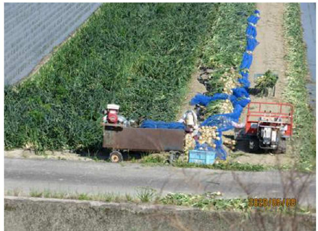
河口部両岸で玉葱収穫状況、田植えは殆ど終わっている