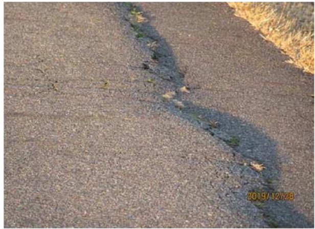
堤防外側部 路肩部が沈下【通行料は少ない場所：規制区間】