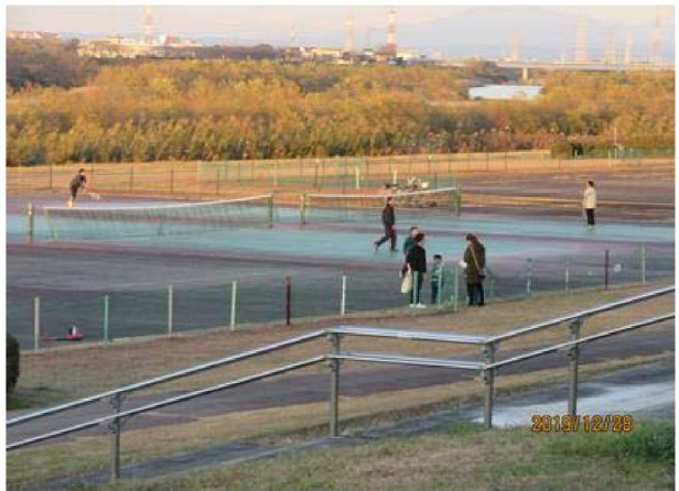
テニスを楽しむ人々【左岸、西尾市の河川敷運動場】