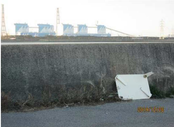
【左岸河口部】 折畳机放置