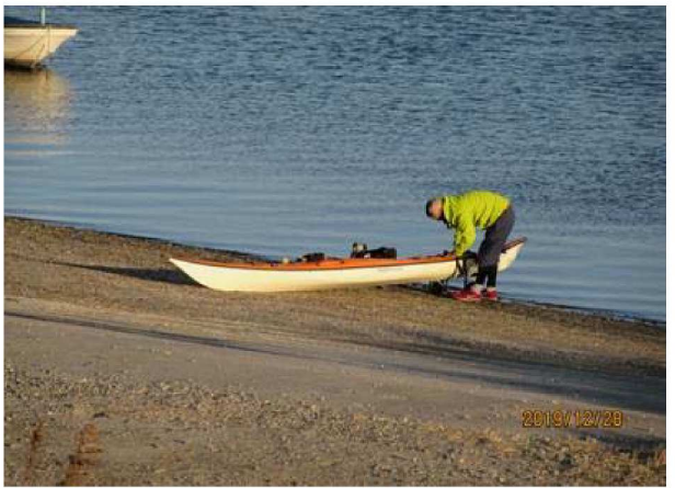
カヌーで楽しむ人【近辺に車なく途中立寄り？】