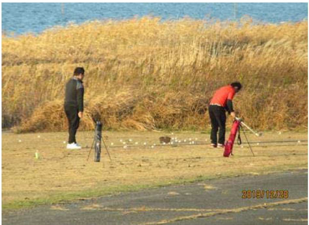
【左岸1.0km】 ゴルフ禁止看板も付近に無し