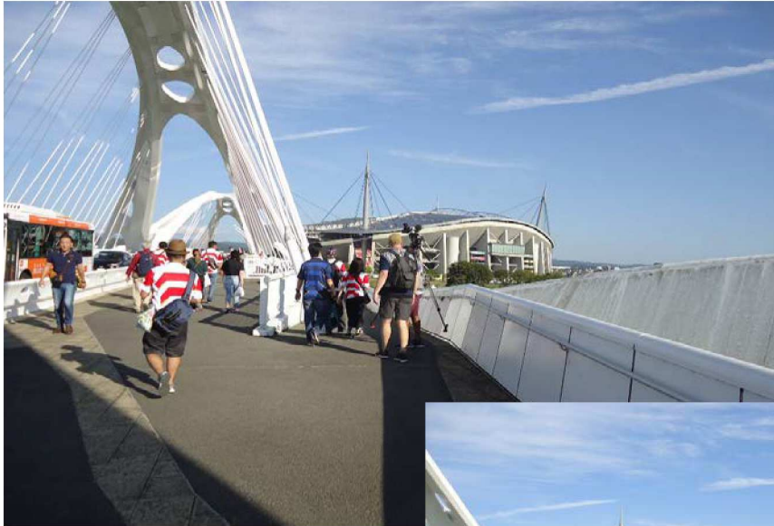
10月5日ラグビーWorld Cup2019 日本vsサモアの豊田大橋とトヨタ スタジアム。外国メディアも矢作川