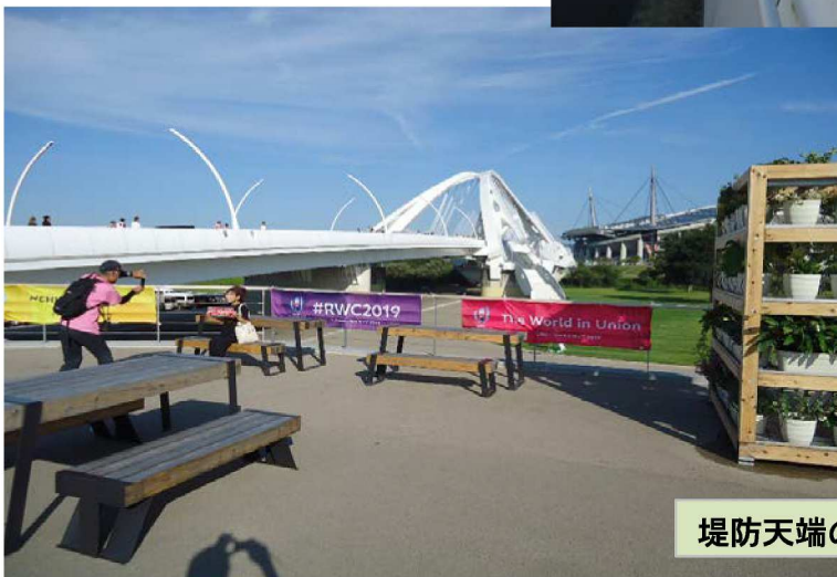
堤防天端のカフェスペースは絶好の撮影スポット。