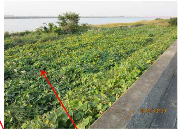
セイタカアワダチソウをつる草 が駆逐しつつ有る状況