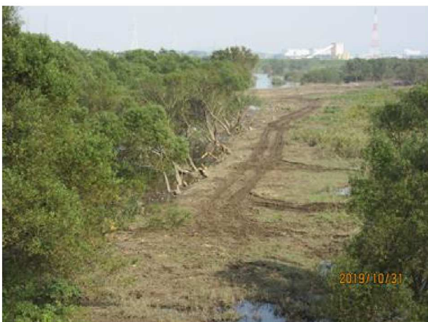
日々伐採が続き 見晴らしが良くなっている 【撮影10月31日】

10年以上【?】伸びた柳の木の伐採が10月初旬から開始、幹が30cm【?】以上の木も多い