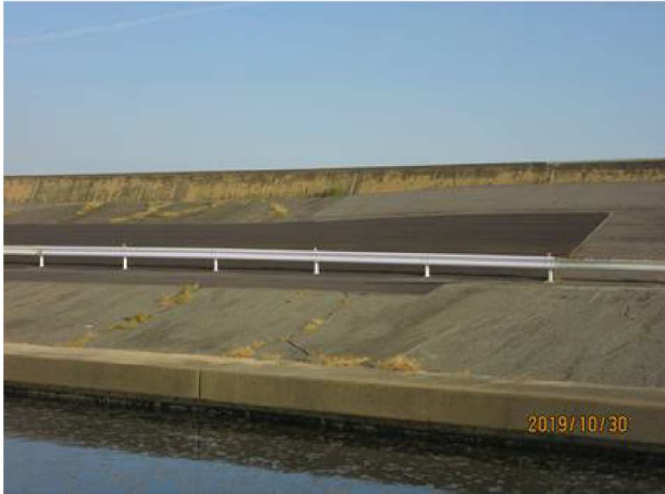
法面の工事はほぼ終了したと思われる