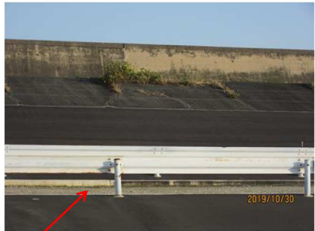
道路部の舗装が一部残る状況