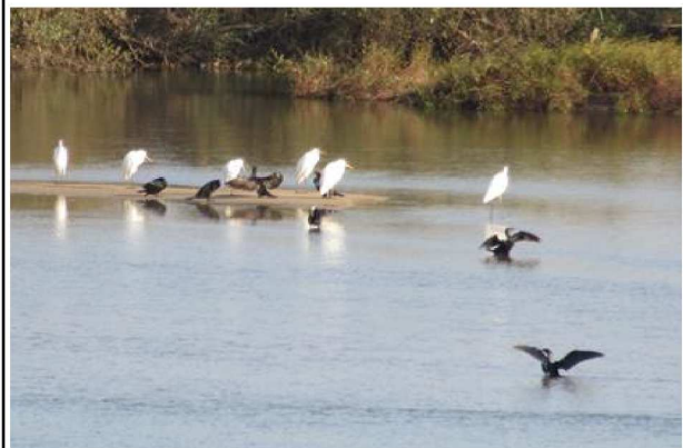
【6.7km】 白鷺と鶺鴒が共に休憩、魚を取っている 【30羽位集合、11月2日撮影】