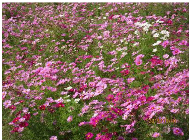
【左岸 6.6km】堤防近くの田圃でコスモスの花が満開 【5反: 5,000㎡位】 【撮影 10月31日】