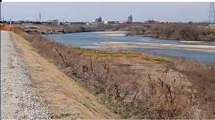
左岸13.4km護岸工事中の風景