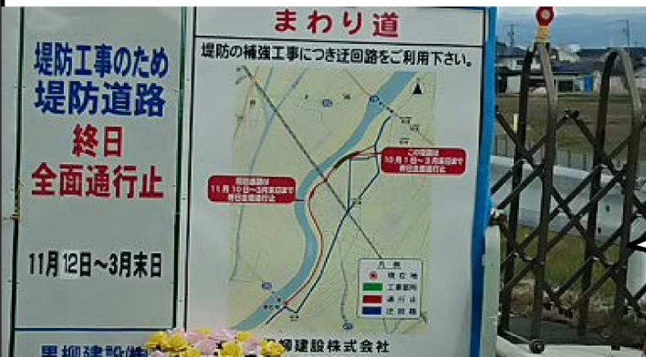
左岸14.1km見合橋と小川橋管は全面通行止め。