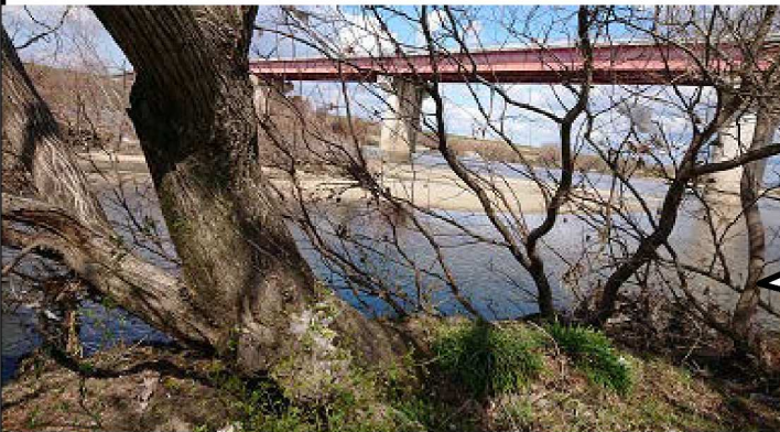
左岸13.9km表側護岸の泥やなぎは直径1mはある。