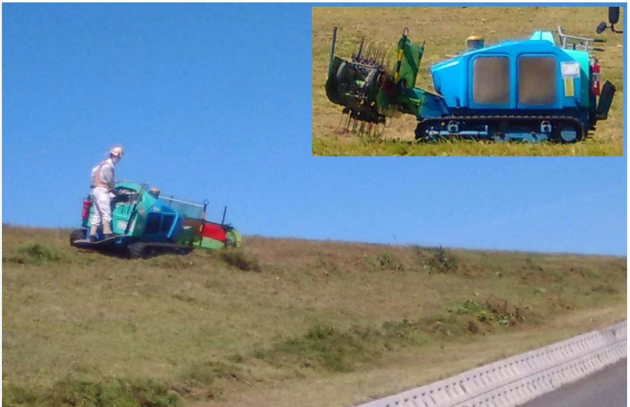
集草機と作業の様子。