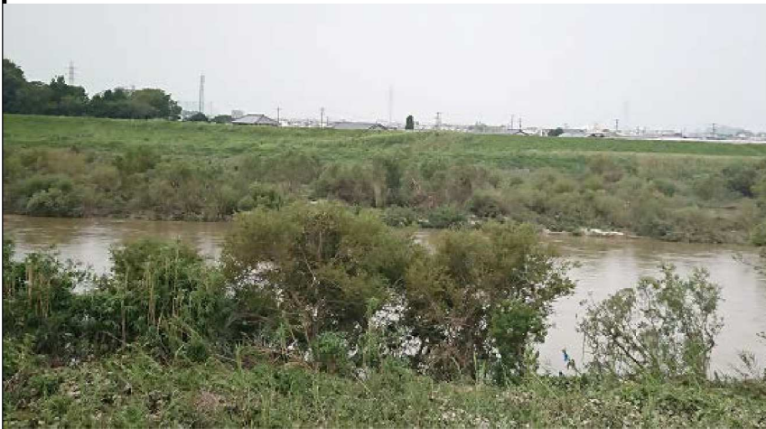
左岸14.1KM 地点雑木が濁 流で倒れてい る。