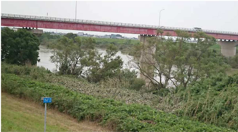
左岸14.2KM地点 台風の翌日 の小川橋、