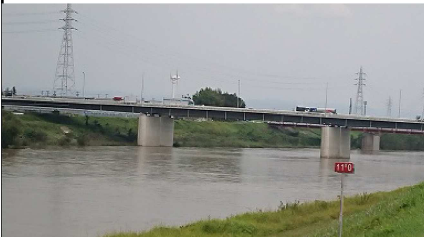
左岸11KM地点 台風の翌日 の志貴野橋。