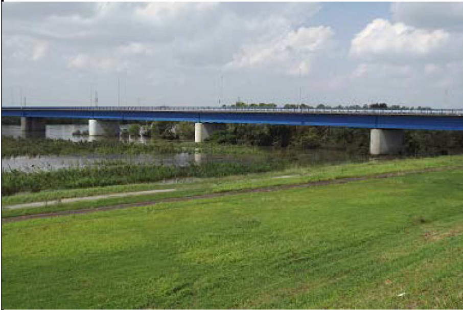
左岸6. 9KM地点台風の翌日の天端から見た上塚橋と水路