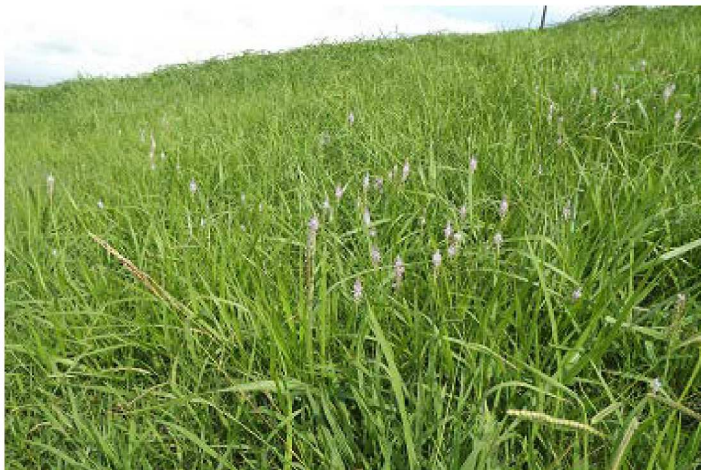
左岸5. 1kmの法面にはツルボがたくさん咲いている。