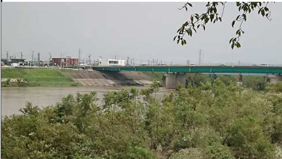
左岸9. 9KM地点台風の翌日の天端から見た米津橋と水路。