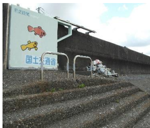
前芝陸閘10号門扉横のゴミ