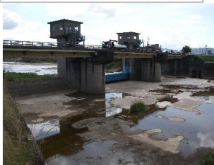
分流堰下の川底露