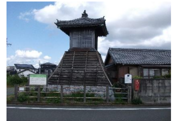
観光名所の前芝灯明台