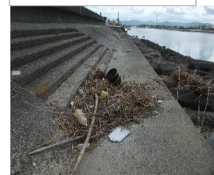
同所河川敷のゴミ