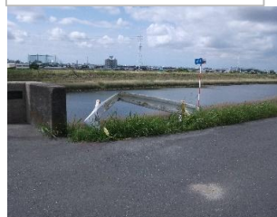
篠束橋直近の壊れたガードレール