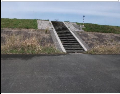
小坂井大橋右岸堤防階段