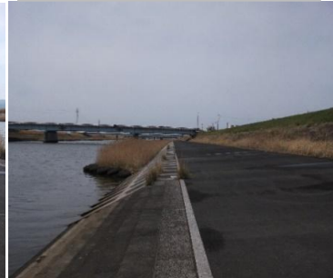
河川敷下のヨシの茂み