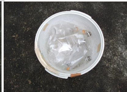
ペットボトルのゴミ(圧縮)