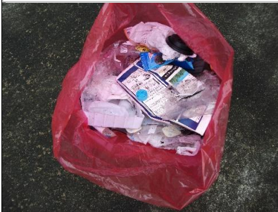
上記場所の燃えるゴミ(圧縮)