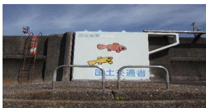
同日撮影の陸閘10号門扉