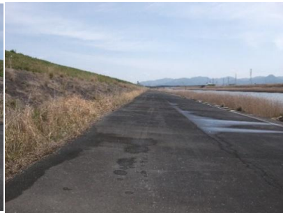
小坂井大橋堤防、河川敷