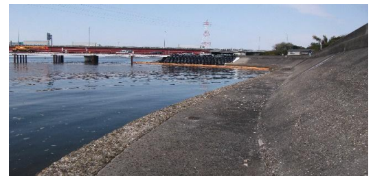
豊川橋上流右岸の堤防、河川敷