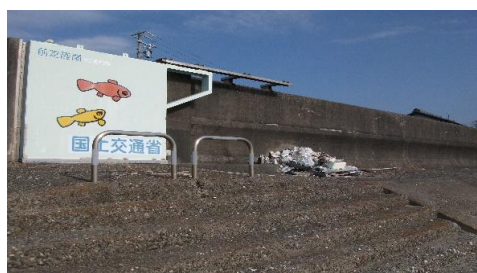
豊川橋上流右岸堤防下のゴミの状況