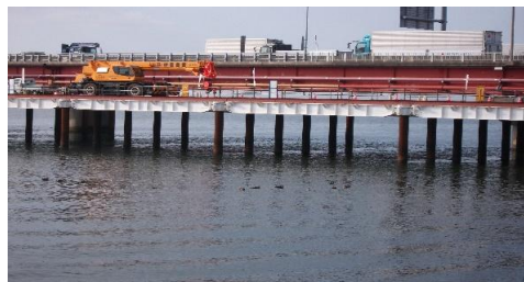
豊川橋の橋の補強工事の現場