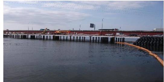
豊川橋の橋の補強工事の様子