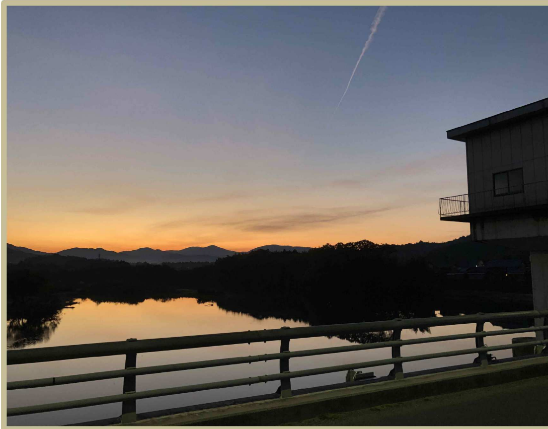
↑牟呂松原頭首工より