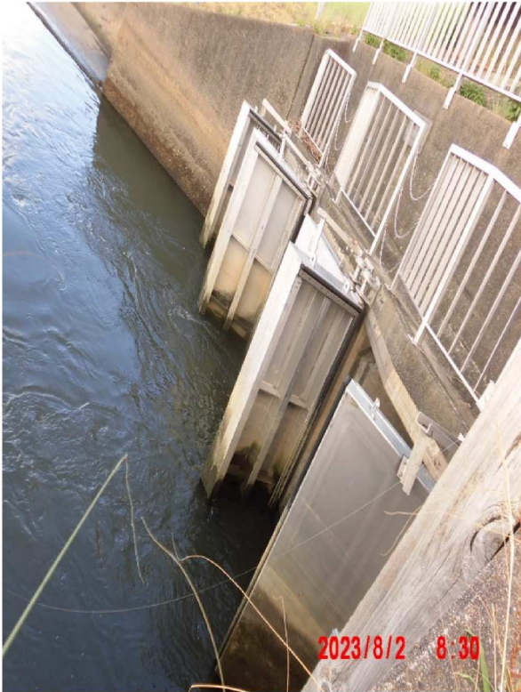
水門が開いて水が流れていました。