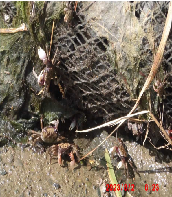
カニもたくさんいました。