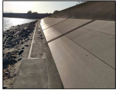
対岸が前芝になります。のり面はきれいなコンクリートです。 草木は生えていません。