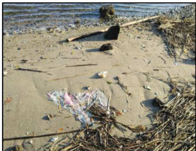
釣り用のリールが落ちています。 プラスチックのゴミが打ち上げられています。