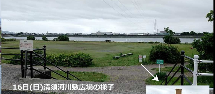
16日(日)清須河川敷広場の様子