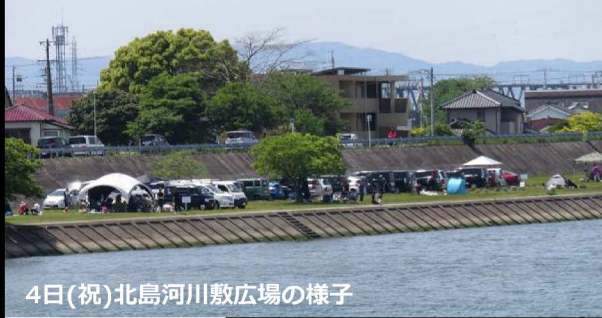
4日(祝)北島河川敷広場の様子