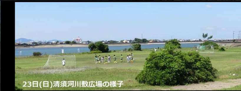
23日(日)清須河川敷広場の様子