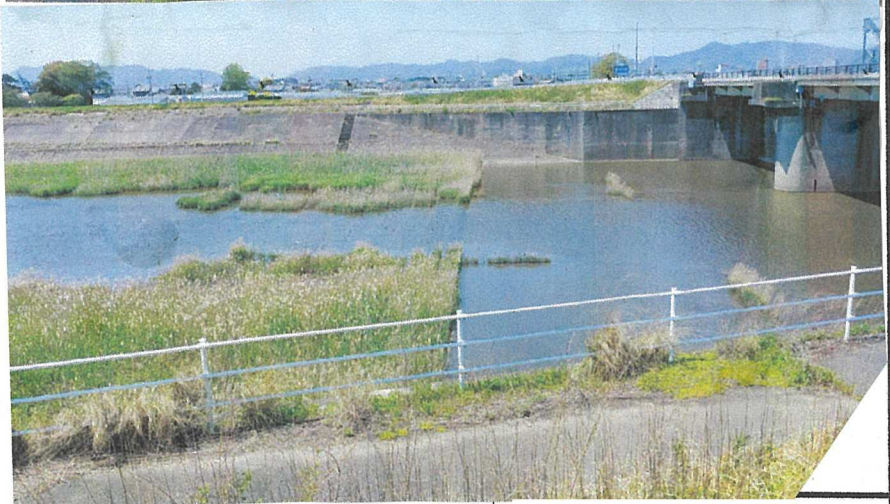
河川愛護モニター