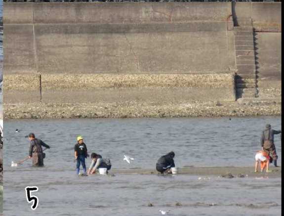
1：前芝の豊川右岸の河口付近では潮干狩りをする人で賑わっていました。数えると50人以上。左岸側も、娯楽を楽しんでいる様子。2：左岸河口に来てみると、水底はカキがいっぱい生息しているよう。食べられるのかは？3：堤防上にある三角の隙間にカタバミが。家紋にもなる植物の繁殖力すごい。4：タデジマイソギンチャク。私は、縮んで触手を出していないこのきれいなビー玉状態しか見たことがありません。