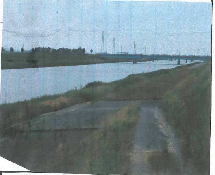
河川愛護モニター

◎8月以降は利用の形態も若干変わってくる可能性(バーベキューなど)が考えられることからそういった視点も取り入れながら活動をしていきたいと考える。