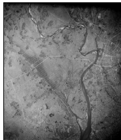
空から見た豊川放水路(1940年:放水路建設前)