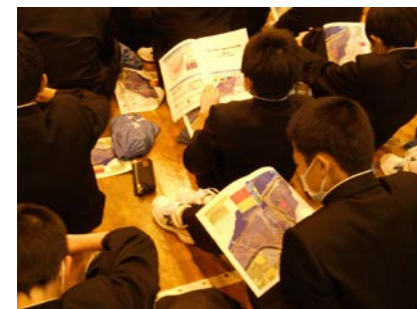
▲ハザードマップを確認する生徒

ハザードマップを配布、豊川で洪水が発生したときの避難場所、避難経路等について考えてもらいました。