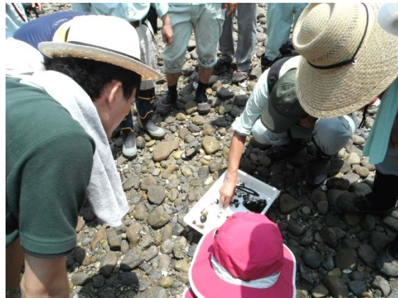
当日採取した生物の説明の様子