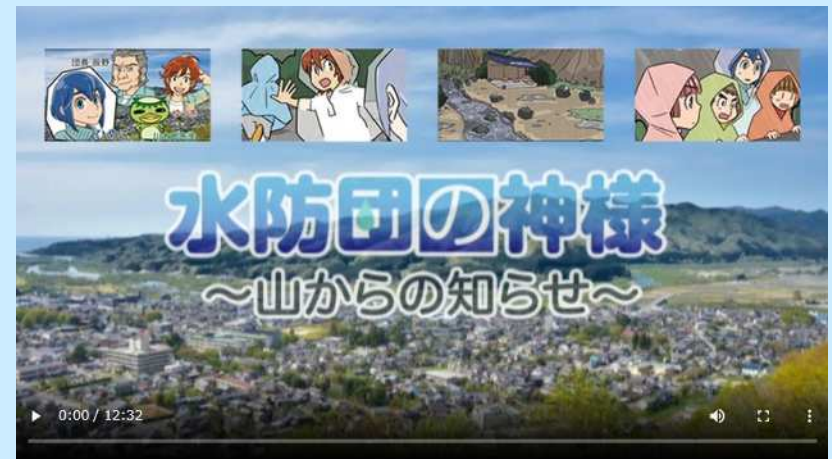
防災アニメ(水防団の神様)