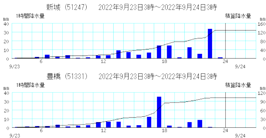
アメダス降水量時系列図

* 解析雨量：レーダーと雨量計による観測の長所を生かして、1km四方の細かさで解析した降水量分布