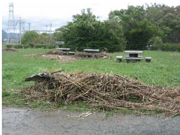
下地緑地 浸水後の状況 (H21.10.8 10:00 撮影)