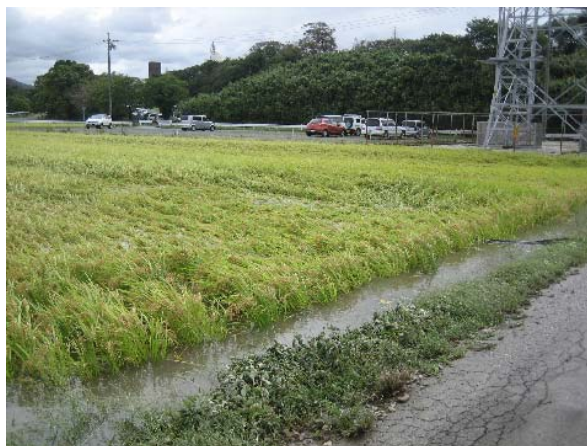
稲の冠水状況 (H21.10.8 10:00 撮影)

※現地での聞きとりによると、6:00～6:30にかけて、一気に浸水し、その後自然排水されたとのこと。水深は、30～70cm。