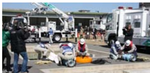
【てきぱきと作業を行う職員】

また、ラジコンヘリの離着陸デモ(人が入り込めない箇所の状況把握に活用)やKu-SAT(衛星小型画像転送装置)による通信デモなどを行いました。