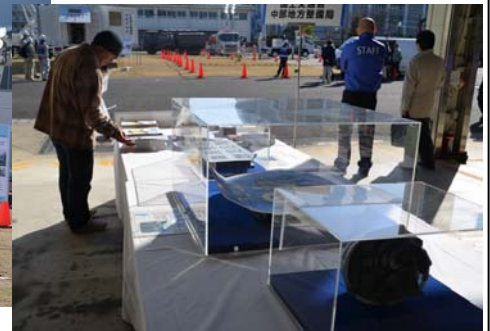
【東日本大震災モニュメント】