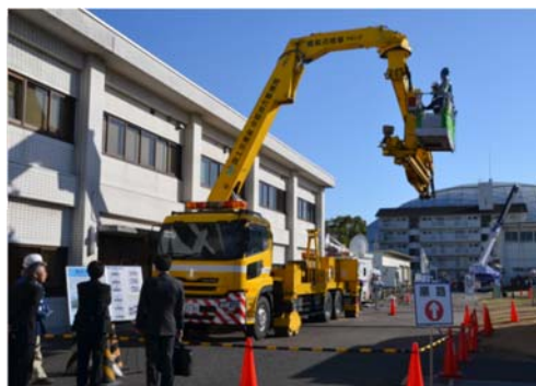
【アームを伸ばした橋梁点検車】