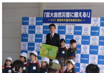
【園児と一緒に記念撮影】