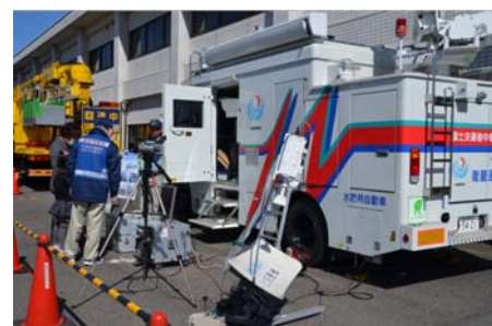
【衛星通信を体験する親子】