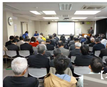
【講演会場もサテライト会場も満席の盛況】

災害時には、臨機に対応が求められる。初動時には、所管にとらわれず「できる者」が行う。←危機管理対応能力を持つ人材育成を！