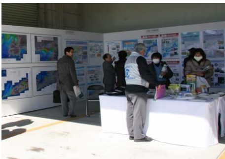
【名古屋地方气象台】