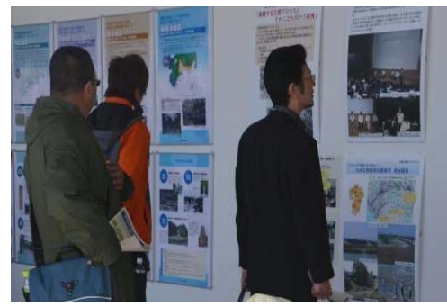
【中部地方巨大災害タスクフォース】