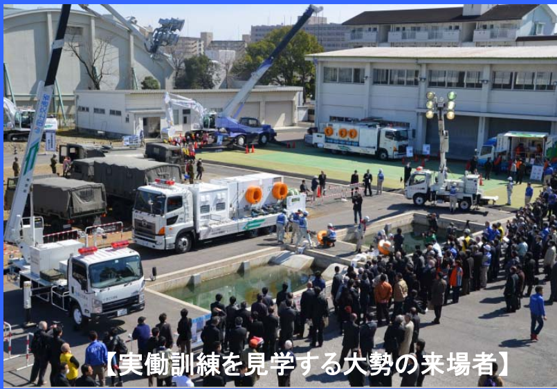
【実働訓練を見学する大勢の来場者】