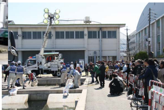
【職員の作業を見守る来場者】