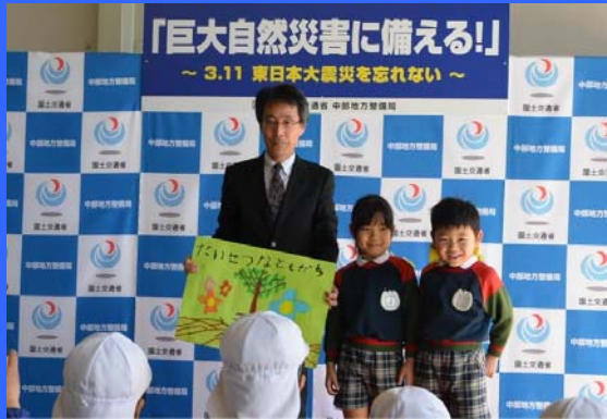
「巨大自然災害に備える！」 ～ 3.11 東日本大震災を忘れない ～ 局長と名城幼稚園の園児