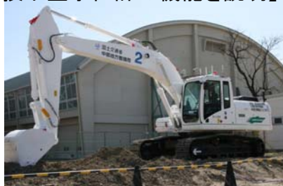
【リモコンで動く分解型バックホウ】