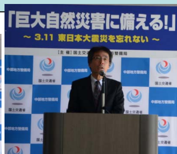
【梅山局長の開会挨拶】