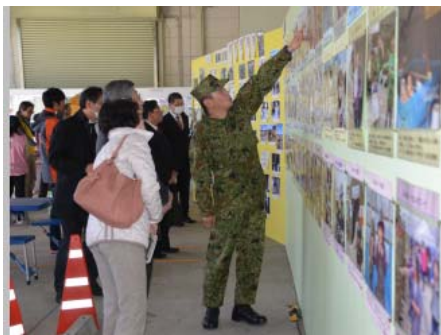
【陸上自衛隊第10師団】