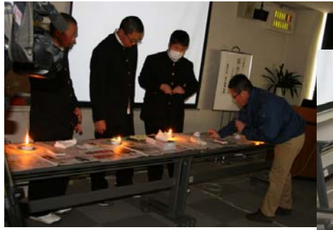
【聴講者も実験に参加】

聴講者の方も実際に体験し、楽しみながら防災に関する知識を深めることができました。