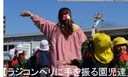
【ラジコンヘリに手を振る園児達】