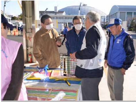
【なごや防災ボラネット】