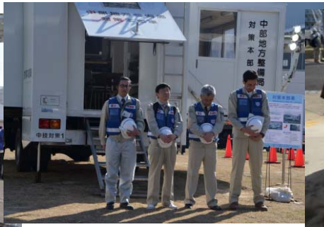
【黙祷するスタッフ、職員】