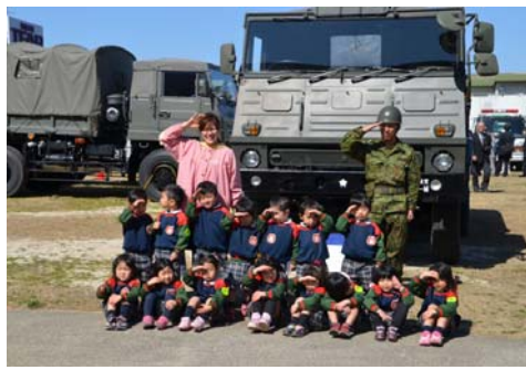
【陸上自衛隊第10師団】