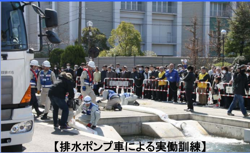
【排水ポンプ車による実働訓練】