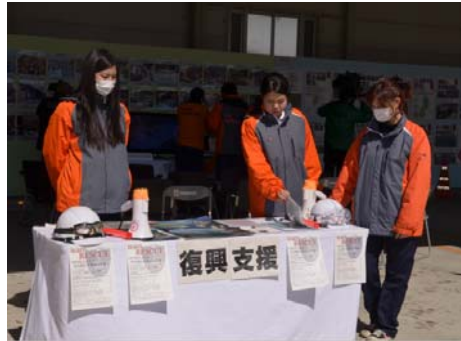
【NPO法人チームレスキュー】