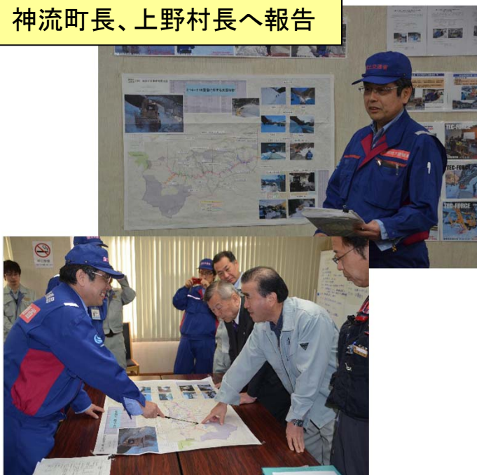
神流町長、上野村長へ報告