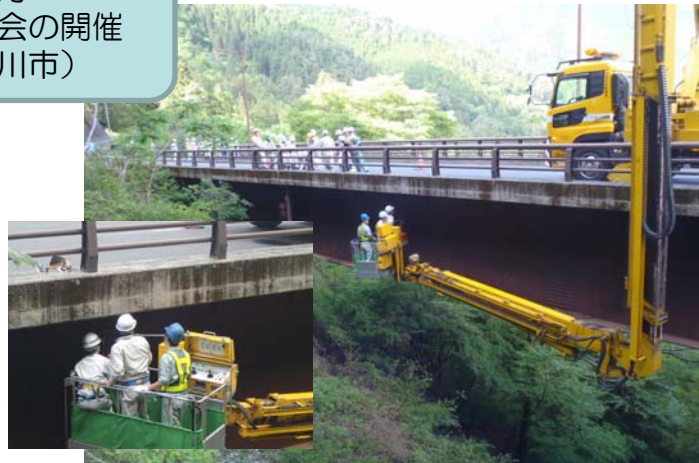
【橋梁保全講習(座学)】