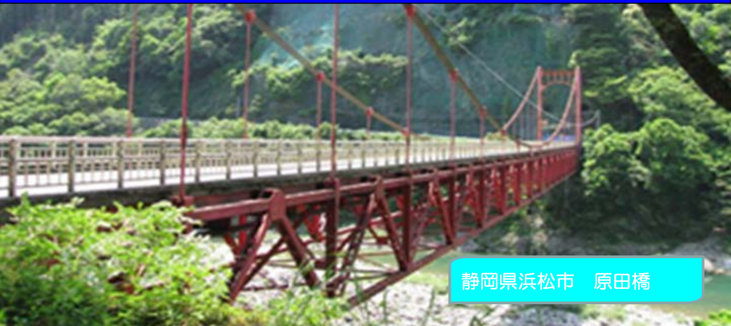
静岡県浜松市 原田橋