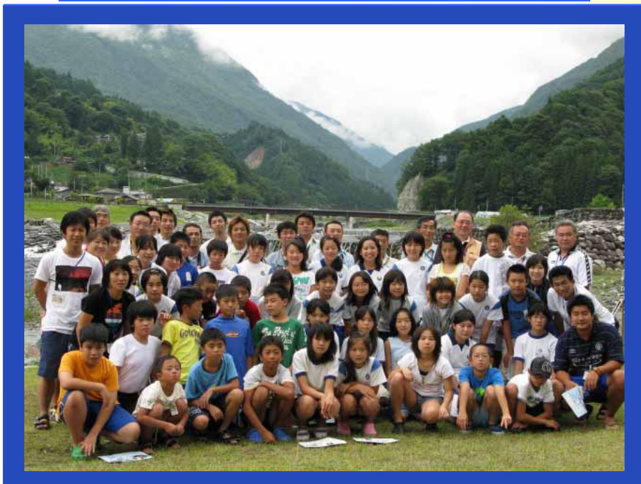
閉会式 良い体験ができました。ありがとうございました！！