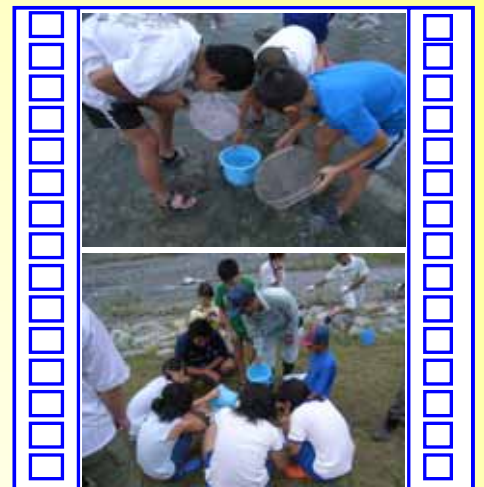
やさしい測量体験 こんなに見えるんだ！