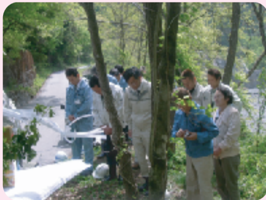
工事着手前に、安全祈願祭を行ないました。

塩川の梨原砂防えん堤直下に存在する岩山の崩壊堆積土および崩落を起こしやすい上部の土砂を取り除き、塩川の河道確保と洪水時の土砂流出を防止することを目的とする工事です。