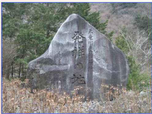
天竜川直轄砂防発祥の地碑

現在行われている大鹿村での治水事業は、国土交通省の直轄事業が行われていること、大鹿村がたいことである。大鹿村は、昭和十二年、当時の内務省名古屋土木出張所小渋川砂防工場の設置、小渋川上流の釜沢堰堤の施工が最初であります。このときは、大変驚異であり、感激しました。忘れられることのない昭和十六年六月の梅雨前線の集中豪雨による未曾有の大災害に遭い多くの犠牲者を出しました。しかし、重なる体験も受けました。その後、あつな災害を受けました。不安な日々を送つてまいりました。が、被災後の国土交通省の復興工事も、防災対策の諸事業が継続されています。大変心強く、又感謝に耐えたい次第であります。村当局は当然のこと、交通省の力を借りて協力しなければならぬと思ふことを強く促していただきます。