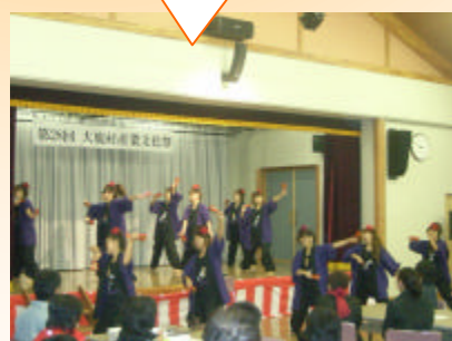
乱舞咲のみなさん！ 伊那谷芸術祭の後、かけつけてくれました！