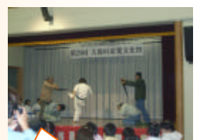
空手キックでバットが折れた！！ すごい...