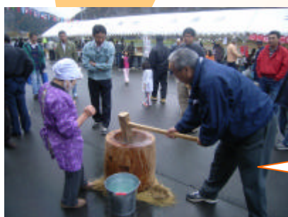
もちつき大会！ もちはこうやってつくんだ！！