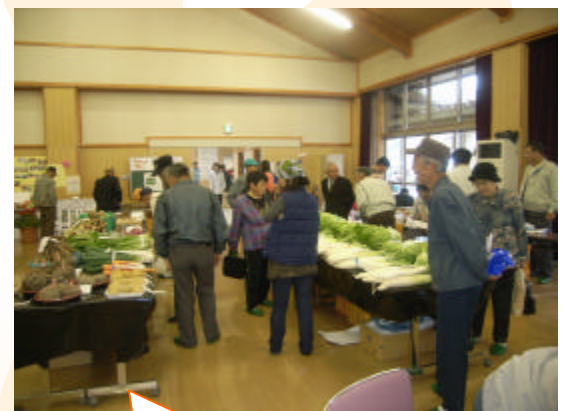
村民のみなさんの農産物や作品が展示されていました。