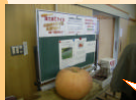
かぼちゃの重さ当て！ これは大きい！ 重い...