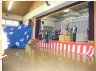
獅子舞！ 所狭しと会場内を暴れまわる！