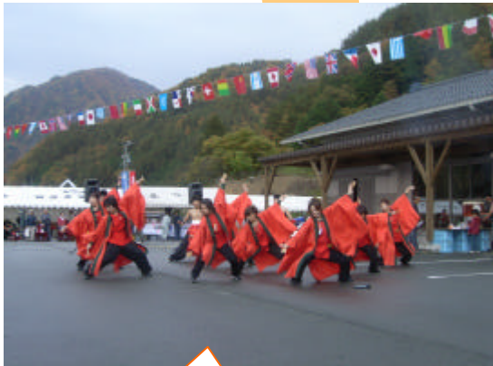
美翔連！ 最高にかっこよかったです！

平成19年11月11日、『第27回大鹿村産業文化祭』が開催されました。あいにくの天候のなか、約300人の参加者が集まり盛大におこなわれました。途中「あられ」が降るアクシデントもありましたが、最後まで会場の熱気は冷めることなくとても楽しい文化祭となりました。