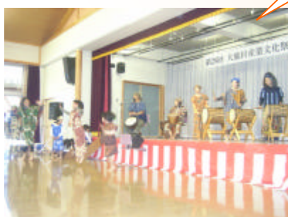
アフリカダンス！ 子供も大人も太鼓のリズムで飛び跳ねる！