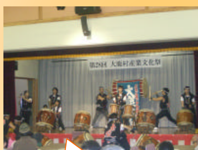
太鼓の音が会場内に響き渡りました！ かっこいい！