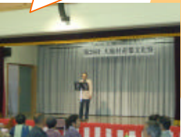
熱唱！！ カラオケ大会！