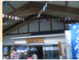
会場にはいろんな農産物や雑貨、食べ物がたくさんありました！