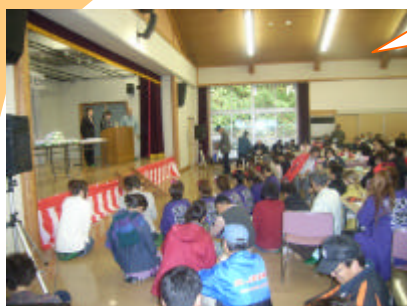
ビンゴ大会！ 一位の景品はかなり大きな箱だったぞ！