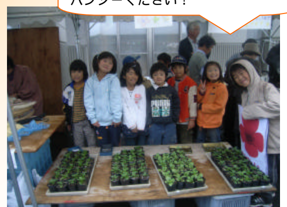
いらっしゃいませ！！ ちいさなお花屋さんもありました！ パンジーください！