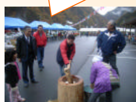
もちつきっていがいとむずかしい...