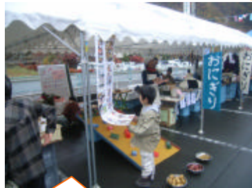
ジャガイモゲーム！ いがいとむずかしい...