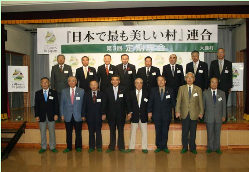
↑全国から集まった美しい村の村長さんと関係者のみなさん。 今年の総会では新たに2つの村が連合に加わり、「日本で最も美しい村」は11村になりました。

2005年10月、「日本で最も美しい村」連合が全国7つの村からスタートしました。 大鹿村では発足当初からこの連合に加盟しており、村民の皆さんを中心に大鹿村の美しい景観や伝統文化を守るための様々な取り組みが行われています。また、全国各地の連合に加盟している村でも同様の活動が行われています。 今回のくろゆり通信では10月4日に大鹿村で行われた「日本で最も美しい村」連合の第3回定期総会の模様と、連合に加盟している全国の美しい村を紹介します。