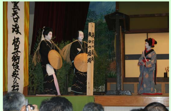
↑いまや大鹿村の代名詞ともいえる大鹿歌舞伎。当日は全国から集まった関係者約130人の前で披露され、大きな拍手と声援が送られました。