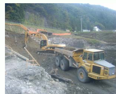
1号帯工 床掘作業状況

大西グラウンド下流にて小渋川の護岸工事を行っております。 工事中は、大変御迷惑をお掛けしますが、皆様の御協力をお願い致します。 また、工事にお気付きの点がありましたら、下記までご連絡下さい。