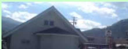
食事所はいから村(大鹿村交流センターの隣)

現場代理人の一言 <工事屋さんに嬉しい、大鹿村の宿泊施設&昼食の美味しい場所> 単身赴任者には嬉しい、お袋の料理が楽しめます。 もちろん昼食などのランチもあります。 一度、召し上がるとやめられない味です。 特に日替わりランチは健康に気を使ったメニューが印象的です。 ペンションには、宿泊施設も完備されています。