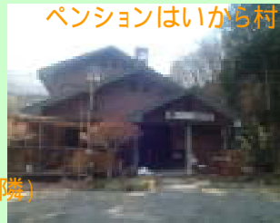
ペンションはいから村