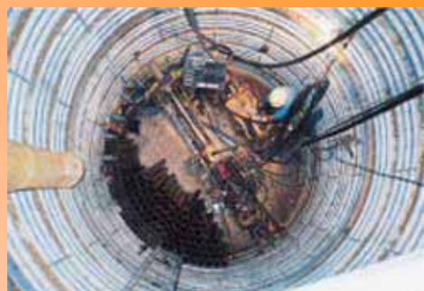
集排水ボーリング 施工状況