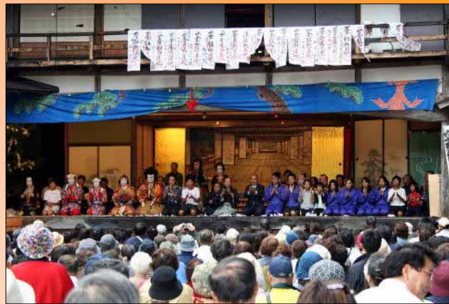
奥州安達原三段目 袖萩祭文の段 (大鹿中学校歌舞伎クラブ)

さる、10月16日(日)正午より 鹿塩 市場神社において、「大鹿歌舞伎 秋の定期公演」が開催されました。県内外から集まった1,500人ほどの観客の見守る中、大鹿中学歌舞伎クラブにより「奥州安達原三代目 袖萩祭文の段」、大鹿歌舞伎保存会により「六千両後日之文章 重忠館の段」の2公演が行われました。2公演共に、さすが【国選択無形民俗文化財】と思わせる熱演ぶりで大盛況でした。これからも、このような素晴らしい文化を途絶えることなく受け継がれることを熱望します。