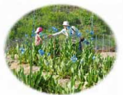
満開の花をたのしむ親子

大鹿村の大池地区(標高1500m)に「ヒマラヤの青いケシ」と呼ばれるメコノプシスが5月の終わり頃から6月下旬までヒマラヤンブル-を楽しませてくれます。大鹿で咲く品種は、メコノプシス・グランディスとメコノプシス・ベトニキフォリアで原産地はヒマラヤで短期間しか咲きません。気温が25度を超えず、適度な雨などの条件から「幻の花」とも呼ばれます。今年、5月の気温が低い日が続いた為、例年より15日ほど満開の時期が遅れたそうです。