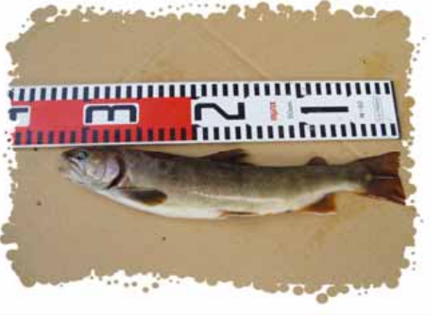
現場で見つけた天然イワナ (ヤマトイワナ)

7月15日 金曜日 天気 ☀️ 大きい天然イワナみつけたヨ!! 今日現場で大きな天然イワナを つかまえました。場所は釜沢の 橋の下です。水がきれいで、 木陰が涼しいので、イワナが たくさんいます。写真を撮りたい ので、3時間ほど待ちました。 (写真)