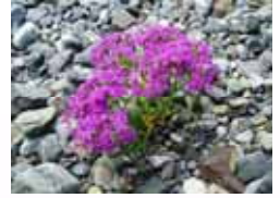
現場で見つけた花 (大和なでしこ)