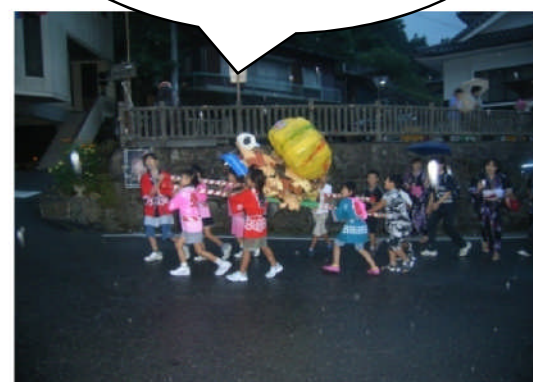
神輿を担ぐ子供達