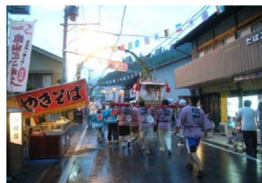
和田の街を練り歩く