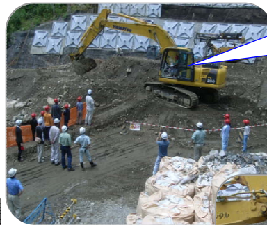
【生徒たちによる土入れ】