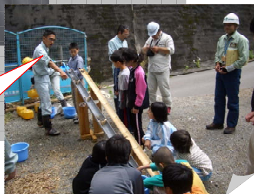
【砂防ダムの模型実験】