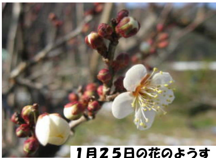
1月25日の花のようす

梅花駅伝にちなんで、天竜村の特産品でもある「梅」の花のようすをお知らせします。場所は、天竜村平岡鶯巣(うぐす)にあるうぐす梅園です。天竜川沿いに約80本の竜峡小梅の木があります。開花は昨年とほぼ同じなので、見頃は2月下旬から3月初旬だそうです。くわしくは、天竜村のホームページに花の様子がアップされています。