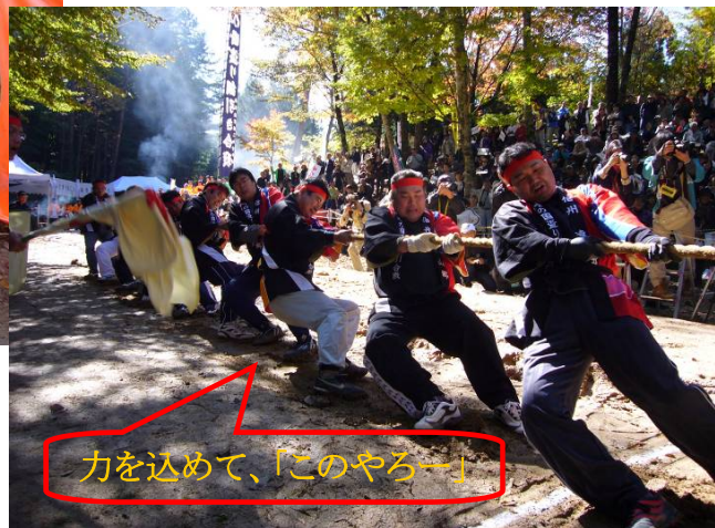
力を込めて、「このやる〜」