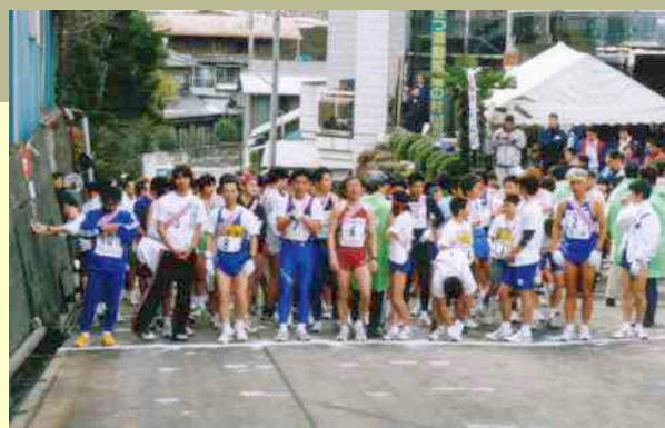
梅花駅伝 スタート風景

天龍村誕生50周年記念第39回天龍梅花駅伝が、平成19年2月18日(日曜日)に開催されます。 記念大会として、中日新聞本社への祝賀飛行があるほか、全日本大学駅伝や箱根駅伝で活躍している駒沢大学駅伝部、24日の全国高校駅伝大会に出場する県代表の佐久長聖高校、東京都代表の早稲田実業学校高等部が、招待出場します。 レースは、総合・地元一般・中学生男女の4部門で競います。 1チームは選手6人、補欠2人以内。参加費チーム単位で一般6千円、中学生3千円。 申込期限 平成19年1月26日までだが、先着110チームで締め切り。 問い合わせ先 天龍村教育委員会内の大会事務局 0260(32)3206 (12/22付 中日新聞記事より抜粋)