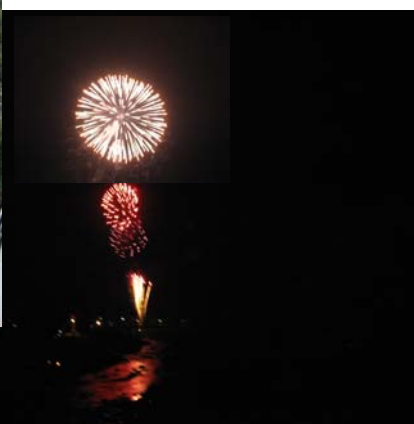
遠山谷 にこだまする 大スターマイ

8月26日、27日に八百年余りの伝統を誇る、南信濃和田の諏訪神社祭典「御射山祭り」が盛大に、繰り広げられました。飯田市と合併して初めての祭典で例年より、にぎやかに感じられました。初日は、保育園児から青年会の若者、又常会の老若男女が、御輿を担ぎ「ワッショイ、ワッショイ」と掛け声を響かせながら、和田の商店街を練り歩き、諏訪神社に奉納しました。26日夜は、かぐらの湯前の河川敷にて大煙火大会がありました。遠山郷の花火の特徴は、深い谷にワッテンゴ遅れて揺るがす程の音を響かせる事です。27日(2日目)は、青年会主催の演芸大会です。トラックの移動式舞台上で巡回し、舞踊を披露して、祭りに華を添えます。祭りが終わると、遠山郷は、朝晩気温が下がり、吹く風も秋の気配が感じられる様になります。