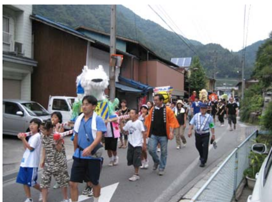
初日子供、大人の御輿にて練り歩き