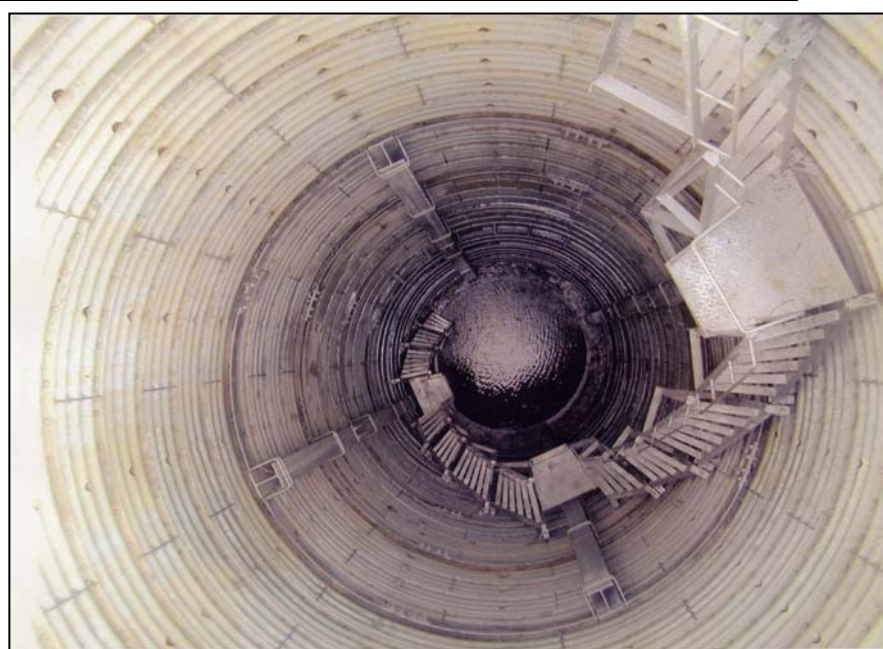
地すべり対策事業イメージ図