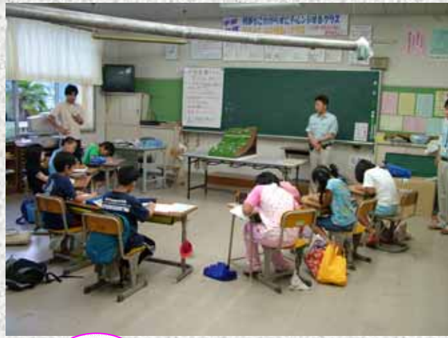
和田小学校のみなさん