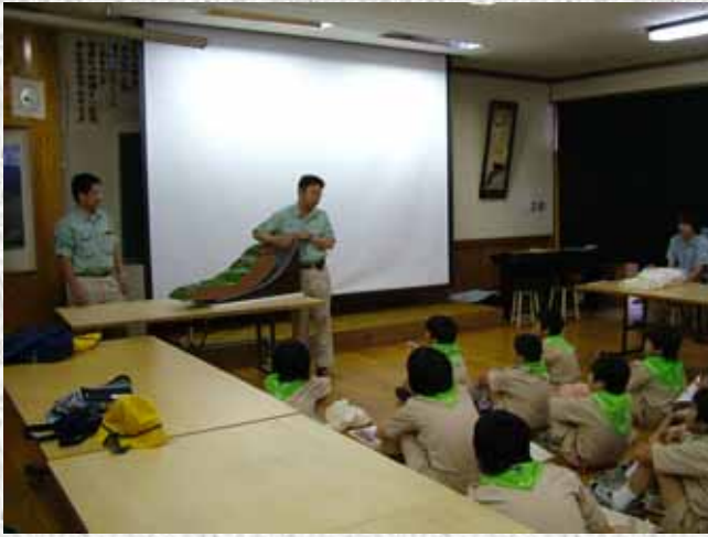
上村小学校のみなさん

6月25日・28日に上村小学校と和田小学校の生徒さん達を対象に現場見学会を開催しました。実際に堰堤や床固めの現場へ見学に行き、実験やクイズなどを交えた説明によってより災害や砂防に関する理解が得られたことと思います。