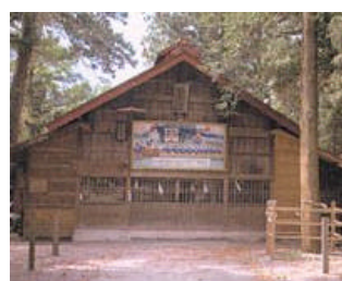
和田諏訪神社の湯飾り