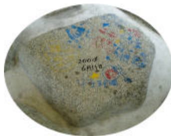
『吠きなくなっても忘れないで』と、6号床固の転石に名前を書きました。