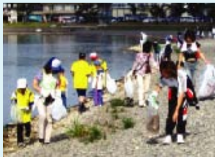
親子参加による湖岸清掃の様子

下諏訪町諏訪湖浄化推進連絡協議会(略称:湖浄連)は、天竜川の源である諏訪湖で活動している団体です。かつての諏訪湖は厚いアオコ