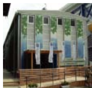
水と緑のパビリオン全景

中部地方整備局などで構成される「21世紀の社会資本を考える実行委員会」では、愛・地球博に「水と緑のパビリオン」、「くねくね体験散歩道」及び「催事プログラム」からなる『水のループ』を出展しています。立体映像シアターや降雨体感施設などがあり、水循環のしくみや水の働きなどを体験できます。会場を訪れた際には、是非お立ち寄りください。詳しくは、下記「水のループ」ホームページをご覧ください。