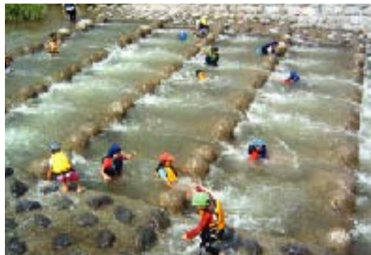
川の流れを実感。夏の講座は涼しさ満点!

飯田市 ● 天竜川総合学習館「かわらんべ」 飯田市川路7674番地 TEL0265-27-6115