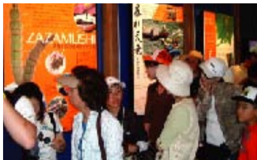
期間中は、延べ47,000人の来場者で賑わいました。

現在、愛知県で好評開催中の《愛・地球博》(正式名:2005年日本国際博覧会)長久手会場において、5月27日から「水と緑のパビリオン」館内で「中部地方の河川旬間」と題し、中部地方の7河川の「パネル展」(各河川10日間)を開催しています。その第1弾として5月27日から6月5日まで行われた「天竜川旬間」では、天竜川の概要や“ざざ虫漁”などを紹介した4枚のパネルを展示しました。