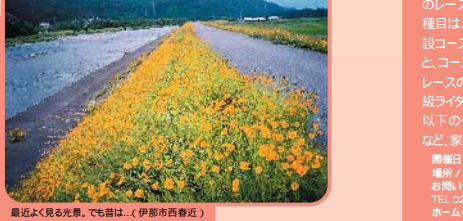
最近よく見る光景。でも昔は... (伊那市西春近)