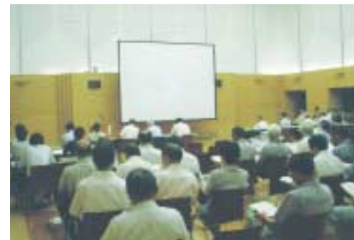
河川懇談会(伊那市)

かわらんべ Information 天竜川総合学習館「かわらんべ」 飯田市川路7674番地 TEL.0265-27-6115 kawaranbe@tenjo.go.jp